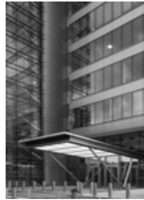
Ducat Place III (22—23)