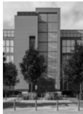
«Фабрика Станиславского» (30-31)