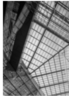
Silver City (28—29)