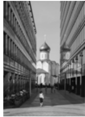
«Белая Площадь» (20-21)