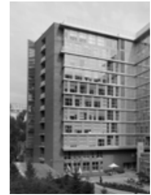
«Вивальди Плаза» (34-35)